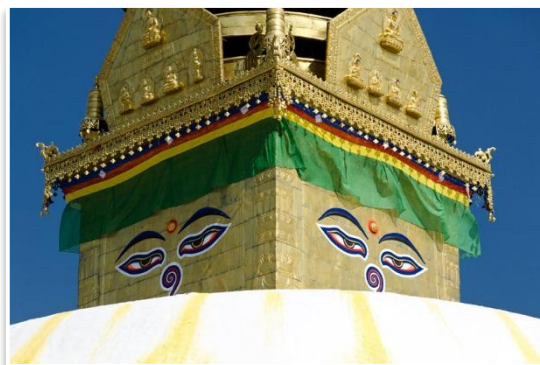
Świątynia Małp - Swayambunath

Rafting (impieza fakultatywna) – w połowie drogi będzie można wziąć udział w raftingu - spływie pontonami po Rzece Trisuli. Po jego zakończeniu obiad w uroczym obozie położonym nad samą rzeką. Koszt to około 50 US$/os (przy minimum 6 zainteresowanych osobach).