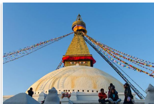
Stupę Boudhanat, Kathmandu

Uwaga: W Pokharze będzie można nieodpłatnie przechować część bagaży niepotrzebnych w czasie trekkingu.