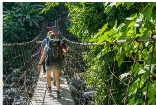
Okolice wsi Naya Pul