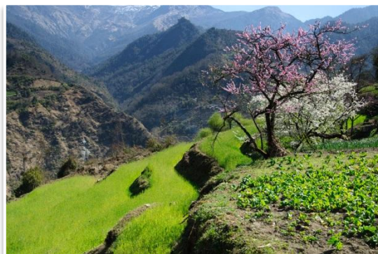
Okolice wsi Sikha