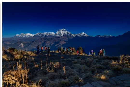
Panorama Himalajów z Poon Hill