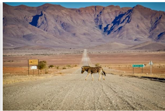
Trasa w okolicach Sesriem

Windhoek opuścimy wcześniej rano odwiedzając Akr Bohaterów – miejsce poświęcone pamięci osób, które przyczyniły się do uzyskania przez Namibię niepodległości w 1990 roku. To doskonałe miejsce aby poznać zarys niedługiej historii kraju. Następnie udamy się do pustynnego obozu nieopodal Sesriem . Znajdującego się na granicy P.N. Namib-Naukluft . Przejazd tam zajmie około 4,5 godzin. Na miejscu udamy się jeszcze na spacer po Kanionie Sesriem. Nocleg w obozie.