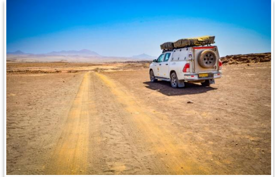
Odludne i surowe obszary okolic Krateru Messum

Wczesnym rankiem opuścimy Swakopmund i pojedziemy niesławnym Wybrzeżem Szkieletów do Cape Cross . Tam odwiedzimy jedną z najliczniejszych kolonii uchatk południowoafrykańskich . Następnie zjedziemy z asfaltu i drogami szutrowymi będziemy poruszali się przez odludne i surowe obszary okolic Krateru Messum . Naszym celem będzie odnalezienie „świętego graala” botaników, Welwiczii Przedziwnej . Po drodze zobaczymy Masyw Brandberg , z najwyższym szczytem Namibii. Ostatnie 10 km drogi do obozu będzie wiodło przed wymagającą dla kierowców dolinę Rzeki Ugab. Tam spędzimy nadchodzącą noc. Jeśli szczęście dopisze, gośćmi w obozie mogą być pustynne słonie , które przystosowały się do życia w tym surowym terenie.