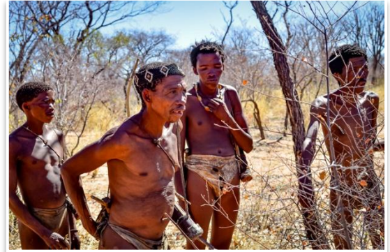
San / Buszmeni

Wczesny poranek poświęcimy na objazd wodopojojów w bezpośredniej bliskości obozu Namutoni. Następnie opuścimy Etoszę i skierujemy się do Grootfontein celem uzupełnienia zapasów i paliwa. Dalej droga doprowadzi nas w busz, do terenów zamieszkałych przez lud San (Buszmenów) . Zamierzamy spędzić z nimi całe popołudnie oraz zanoć przy ich wiosce . Celem będzie poznanie Buszmenów i próba zrozumienia jak jeszcze niedawno wyglądało ich życie. Z jakimi ograniczeniami muszą się dzisiaj mierzyć. Wyjdziemy z nimi w busz, aby dowiedzieć się z jakich roślin korzystają. Dowiemy się w jaki sposób tropią zwierzynę i jak niegdyś polowali. Będziemy mogli samodzielnie zrobić sobie łuk i spróbować swoich sił w strzeleniu z niego do celu. W naszej ocenie, to bardzo emocjonalne i ważne spotkanie z ludźmi, których kultura na naszych oczach zaciera się we współczesności. Nocleg w obozie przy wiosce Buszmenów.