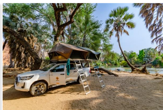
Obóz nad Rzeką Kunene

Każdy potrzebuje trochę wytchnienia i dlatego proponujemy dzień całkowicie wolny od jazdy i pakowania obozu . Czas będzie można poświęcić na spacer nad rzeką, relaks w obozie, sprawy porządkowe, czy wizytę w lokalnym... disco barze.