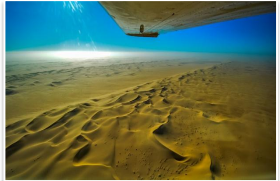
Loty widokowe nad Pustynią Namib