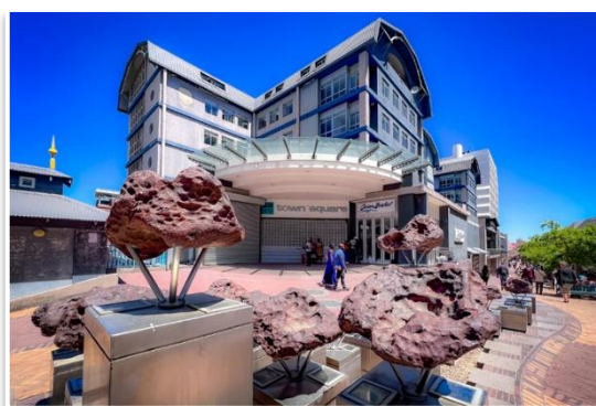
meteoryty Gibeone w Windhoek

Dzień zaczniemy od zobaczenia najciekawszych atrakcji Windhoek. Zobaczymy architektoniczną wizytówkę miasta, kamienny kościół – Christuskirche , wstąpimy do Muzeum Pamięci i Narodowej Galerii Sztuki , zajrzemy do zabytkowego dworca kolejowego . Przejdziemy też przez centrum handlowe z wystawionymi meteorytami Gibeon . Zajrzemy do Buszmen Art Gallery oraz do Starego Browaru . Po obiedzie, udamy się do siedziby firmy wynajmującej samochody. Na miejscu zostaniemy przeszkoleni w zakresie obsługi wyposażenia naszych pojazdów i – już samodzielnie – pojedziemy na zakupy brakującego wyposażenia oraz żywności na kolejne dni wyprawy. Na koniec dnia udamy się do modnej restauracji, na wspólną kolację. Zakwaterowanie w domu gościnnym i nocleg w Windhoek.