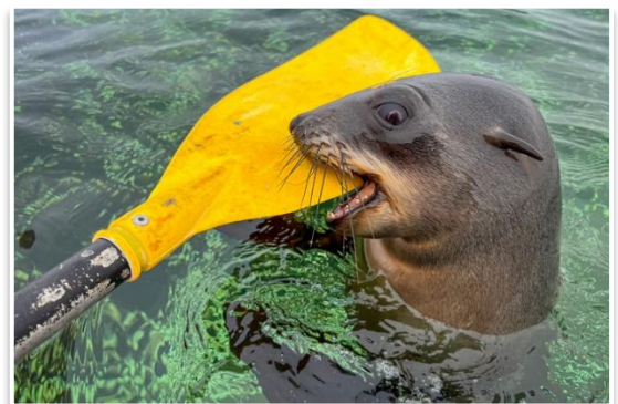
Kajakiem pośród stada uchatek