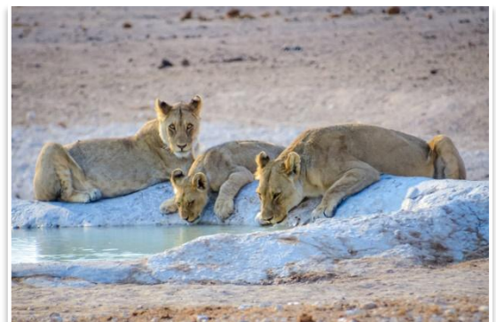
Park Narodowy Etosza

Kolejny pełny dzień w Parku Narodowym Etosza poświęcimy na podglądanie dzikich zwierząt . Tak jak dzień wcześniej, będziemy przemieszczać się własnymi samochodami, od wodopoju do wodopoju. Na koniec dnia dotrzemy do obozu Namutoni (na terenie parku), który również umożliwia nocną, dyskretną obserwację zwierząt gromadzących się przy wodopoju.