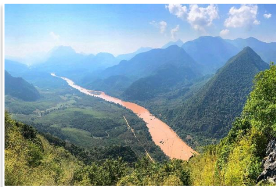
Okolice Nong Khiaw

Aby doświadczyć absolutnego piękna krajobrazu okolic Nong Khiaw udamy się na całodniową wycieczkę po okolicy . Po śniadaniu popłyniemy 1 godzinę łodzią w dół rzeki Nam Ou, do nadbrzeżnej wioski Ban Done Khoun. Stamtąd pomaszujemy około 1 godzinę przez pola ryżowe , docierając do lasu i rzeki spływającej w dół. To miejsce zwane jest przez miejscowych "100 wodospadami". Może nie ma ich dosłownie 100, ale szlak na szczyt wiedzie dokładnie rzeką. Oznacza to wspinaczkę potokiem, często dosłownie w wodzie i przez wodospady . W ten sposób dotrzemy do podstawy wodospadu, gdzie będzie można wykąpać się i odpocząć . Z tego miejsca rozpościera się również wspaniała panorama okolicy . To będzie nasze miejsce na obiad. Od tego momentu rozpoczniemy drogę powrotną. Wróciwszy do wioski zostaniemy tam chwilę, aby przyjrzeć się jak żyją miejscowi . Kolejna godzina rejsu łodzią w górę rzeki doprowadzi nas ponownie do hotelu. Na miejscu kolacja i nocleg.