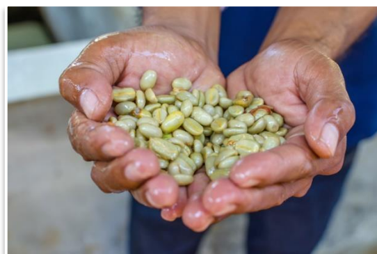
Kawa, Płaskowyż Bolaven

Cały dzień spędzimy na zielonym Płaskowyżu Bolaven , podróżując między wodospadami i plantacjami laotańskiej kawy . Odwiedzimy najwyższy wodospad Tad Fane oraz wodospad Tad Yuang . Zatrzymamy się również na plantacje kawy , gdzie dowiemy się o procesie powstawania kawy i o jej znaczeniu dla lokalnej gospodarki. Po południu udamy się na targ Paksong , świetne miejsce do podglądania lokalnego życia. Wieczorem powrót do Pakse, kolacja, nocleg.