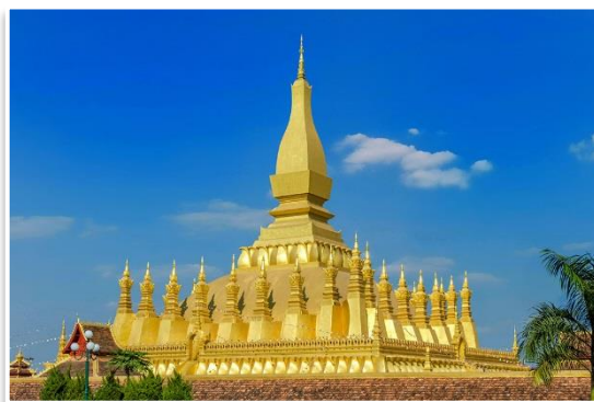
Pha That Luang, Wientian