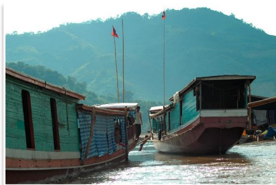
Tradycyjne, długie łodzie na Mekongu

Nad Nong Khiaw górują majestatyczne szczyty. Na trzech z nich umieszczono punkty widokowe . Panorama rozpościerająca się z nich zwyczajnie obezwładnia. Trasa na szczyt jednego z nich zajmuje około 2 godzin, podczas gdy marsz w dół to kolejne 1,5 godz. Jeśli ktoś z uczestników będzie zainteresowany tego typu doświadczeniem, to z przyjemnością będziemy towarzyszyć*. To piękne przywitanie dnia przed dalszą podróżą. Następnie pojedziemy z powrotem w kierunku Luang Prabang. Po około 3 godzinach jazdy i obiedzie, dotrzemy do Pak Ou – niezwyklej jaskini bezpośrednio nad Mekongiem, w której znajduje się ponad 10 000 posągów Buddy . W Pak U przesiądziemy się do charakterystycznej, laotańskiej łodzi pływającej po Mekongu, którą w 1,5 godziny dopłyniemy do przystani w Luang Prabang . Późne popołudnie oraz wieczór zostawimy uczestnikom do samodzielnej eksploracji uroków Luang Prabang. Kolacja we własnym zakresie.