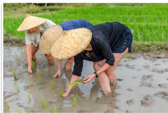
Kurs uprawy ryżu, okolice Luang Prabang

Wielki finał wyjazdu do Laosu. Ryż! – niby oczywista rzecz. Dla połowy świata podstawa diety. Wiemy że wystarczy wyjąć go z opakowania, ugotować i podać. Ale czy na pewno ryż pochodzi z torebki? Chcemy, aby nasi goście na pół dnia stali się... rolnikami! Doświadczymy całego procesu produkcji ryżu . Od wyboru nasion, przez orkę, sadzenie, zbieranie, po łuskanie. Będziemy mogli spróbować swoich sił orząc pole przy pomocy prawdziwego bawoła, bosymi stopami wejdziemy w zanurzone w wodzie poletko, celem przesadzenia sadzonek, czy sami zajmiemy się łuskaniem ziaren. Cały kurs zakończy obiad – oparty rzecz jasna o... ryż. To będzie doświadczenie które zmieni Państwa postrzeganie tego zboża. Zobacz film z tego miejsca: https://youtu.be/WFN6TnPxtt0?si=FRA0aOikUYdigxI6