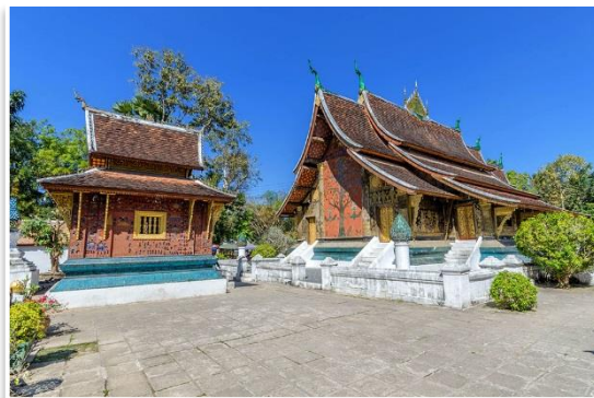
Wat Xieng Thong, Luang Prabang

Po wczesnym śniadaniu opuścimy Vang Vieng i udamy się w 1 godziną podróż pociągiem do najpiękniejszego miasta Laosu, perły kolonialnych Indochin, królewskiego Luang Prabang . Po przyjeździe obiad i zakwaterowanie w hotelu. Następnie udamy się na wspólne zwiedzanie najważniejszych zabytków miasta. Odwiedzimy Pałac Królewski wraz ze wspaniałą świątynią Wat Ho Pha Bang i olśniewającą swoimi zdobieniami Wat Xieng Thong . Zobaczymy też Wat Mai Suwannaphumaham oraz spojrzymy z góry na miasto ze szczytu wzgórza Phu Si . Po zachodzie słońca odwiedzimy istny zakupowy raj – nocny targ rozstawiany co wieczór na głównym deptaku miasta. Kolacja we własnym zakresie, nocleg w Luang Prabang.