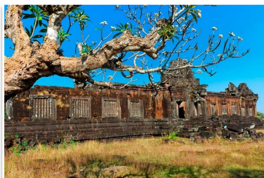
Wat Phu, Chamasak

Po śniadaniu ruszymy na południe, w stronę Kambodży. Po drodze odwiedzimy kompleks świątynny Khmerów - Wat Phu . Następnie, po obiedzie, kolejne 3 godziny jazdy zaprowadzą nas do największego w Azji Południowo-wschodniej wodospadu - Khone Phapheng . W ten sposób dotrzemy do archipelagu 4000 wysp na rzece Mekong - Si Phan Don. Stamtąd będzie już niedaleko do naszego hotelu, wspaniale położonego na wyspie Don Khone , dokładnie na środku Mekongu. Kolacja i nocleg.