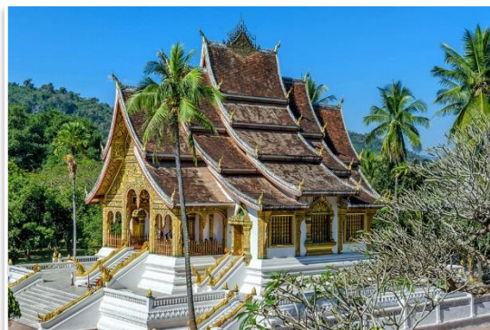
Wat Pha Bang, Luang Prabang

Dzień rozpoczniemy o 04:30 nad ranem* aby być świadkiem jednej z najważniejszych ceremonii religijnych – porannego ofiarowania jałmużny mnichom . Następnie, po śniadaniu, opuszczając Luang Prabang odwiedzimy Centrum Informacyjne Rozminowywania Laosu , co jest nam niezbędne do zrozumienia współczesnej historii kraju. Następnie udamy się do turkusowych wodospadów Kuang Si , gdzie można będzie się zanurzyć w wapiennych wodach laguny. Po drodze zapoznamy się jeszcze z programem ochrony niedźwiedzi azjatyckich. Po południu, po obiedzie ruszymy w 4 godziną podróż do najbardziej malowniczego miejsca na naszej trasie , w region wysokich gór Laosu, do Nong Khiaw . Na miejscu kolacja i nocleg.