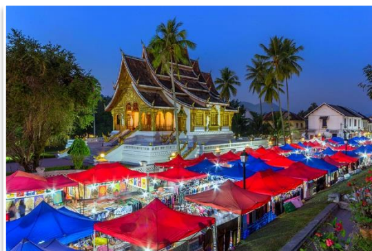
Nocny targ przed Wat Pha Bang, Luang Prabang

❖ Wat Mai Suwannaphumaham – to prawdopodobnie najbogatsza ze świątyń Luang Prabang. Zbudowana w XVIII wieku, w pobliżu Pałacu Królewskiego, mieści posąg Szmaragdowego Buddy.