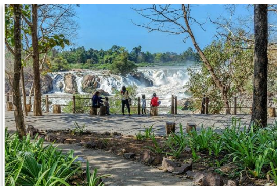
Wodospad Khone Phapheng, Si Phan Don