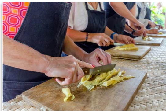
Kurs gotowania, Luang Prabang