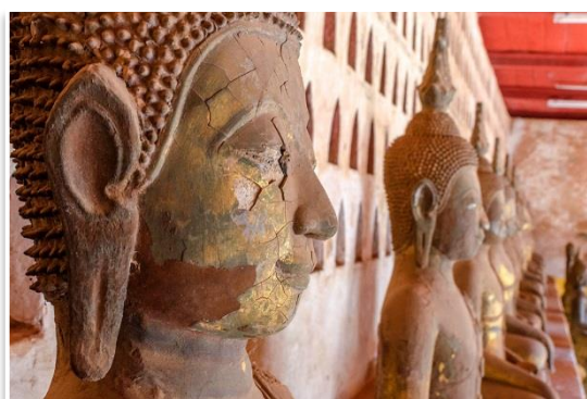
Wat Si Saket, Wientian

Po śniadaniu opuścimy Si Phan Don i po 3 godzinach jazdy dotrzemy ponownie do Pakse , skąd – po obiedzie – polecimy do stolicy Laosu – Wientian . Lot zajmie nam niewiele ponad 1 godzinę. Na miejscu transfer do hotelu. Wieczór spędzimy spacerując po centrum stolicy oraz na kolorowym, nocnym targu , pełnym straganów oferujących wszystko od jedzenia, przez tekstylia, malowidła po proste rękodzieło czy nawet tajską elektronikę. Kolacja we własnym zakresie.