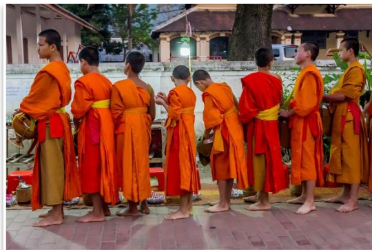
Ceremonia ofiarowania jałmużny, Luang Prabang