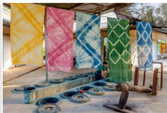
Warsztat naturalnego barwienia tkanin