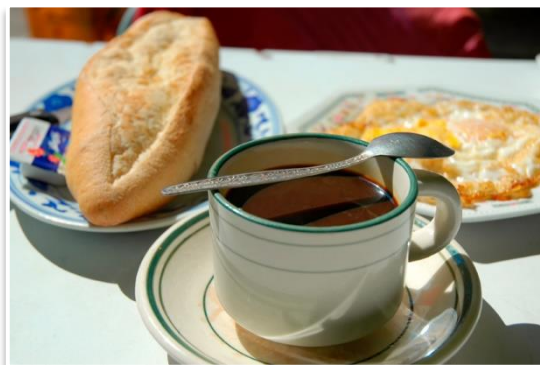
Kawa i bagietka – typowe śniadanie w Luang Prabang