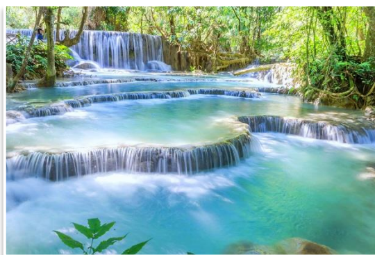
Wodospady Kuang Si