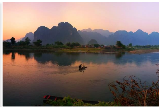
Panorama rzeki Nam Song, Vang Vieng

Cały dzień spędzimy w Vang Vieng , niekwestionowanej, laotańskiej stolicy wszelkich aktywności na otwartym powietrzu. Doświadczymy pięknej, wiejskiej scenerii oraz niepiesznego spływu na nadmuchanej oponie po rzece Nam Song, wijącej się pomiędzy majestatycznymi, wapiennymi górami. Odwiedzimy kilka krasowych jaskiń, których potęga i wielkość zapierają dech w piersiach. Do tego, w ciągu całego dnia będziemy mieli wiele okazji do orzeźwiających kąpeli w krasowych lagunach. Kolacja i nocleg w Vang Vieng.