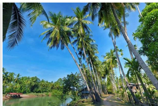
Si Phan Don

Tego dnia będziemy niespiesznie eksplorować uroki rzecznej świata. Na wypożyczonych rowerach udamy się do wodospadu Li Phi , po drodze oglądając pozostałości kolonialnych prób uczynienia Mekongu żeglownym aż do Chin. Następnie przeprawimy się mostem na sąsiednią wyspę Don Det. Tam zjemy obiad z widokiem na rzekę. Później przesiadziemy się do kajaków , którymi wolno popłyniemy rozlewiskami Mekongu, ponownie do wyspy Don Khone. Wolne popołudnie będzie można przeznaczyć na wypoczynek nad basenem lub eksplorację okolicznych wiosek. Kolacja, nocleg.