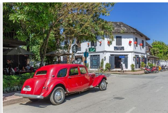
Kolonialna zabudowa Luang Prabang