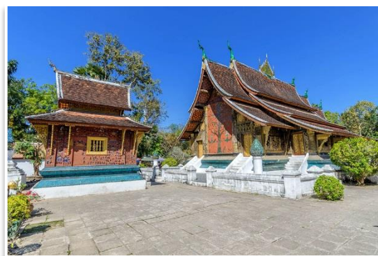
Wat Xieng Thong, Luang Prabang

Po wczesnym śniadaniu opuścimy Vang Vieng i udamy się w 1 godziną podróż pociągiem do najpiękniejszego miasta Laosu, perły kolonialnych Indochin, królewskiego Luang Prabang . Po przyjeździe obiad i zakwaterowanie w hotelu. Następnie udamy się na wspólne zwiedzanie najważniejszych zabytków miasta. Odwiedzimy Pałac Królewski wraz ze wspaniałą świątynią Wat Ho Pha Bang i olśniewającą swoimi zdobieniami Wat Xieng Thong . Zobaczymy też Wat Mai Suwannaphumaham oraz spojrzymy z góry na miasto ze szczytu wzgórza Phu Si . Po zachodzie słońca odwiedzimy istny zakupowy raj – nocny targ rozstawiany co wieczór na głównym deptaku miasta. Kolacja we własnym zakresie, nocleg w Luang Prabang.