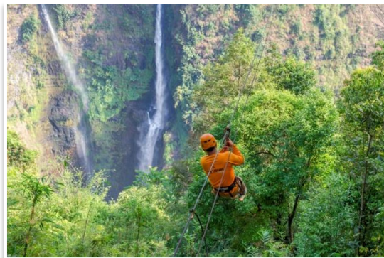
Wat Phu, Chamasak

Dodatkowa atrakcja: Osoby zainteresowane, będą mogły zjechać na linie „tyrolce” ponad najwyższym w Laosie wodospadem – Tad Fane, 120m powyżej dna doliny. W zasadzie nie jest to jeden przejazd, lecz 6 następujących po sobie przejazdów, całość ponad linią drzew. To dosłownie zapierające dech w piersiach doświadczenie. Koszt to około 45 USD/os.