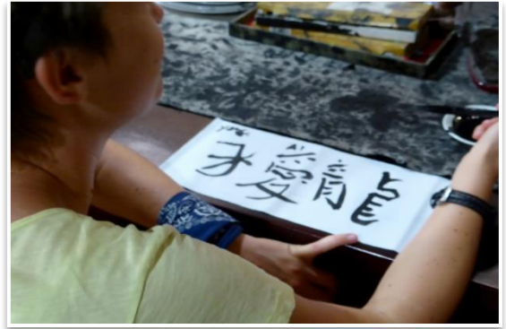
Krótki kurs zapisu języka chińskiego