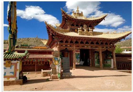
Klasztor Tseway należący do tradycji Bön