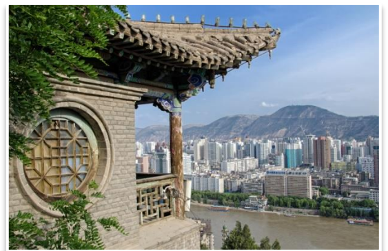
Wzgórze Białej Pagody, Lanzhou

Do Pekinu przyjedziemy w godzinach południowych. Po obiedzie, zwiedzanie stolicy rozpoczniemy od jej architektonicznego symbolu – Świątyni Nieba . Później udamy się na spacer po pekińskich hutongach . Nocleg w Pekinie.