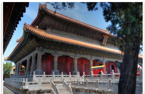
Wielka Świątynia Konfucjusza, Qufu