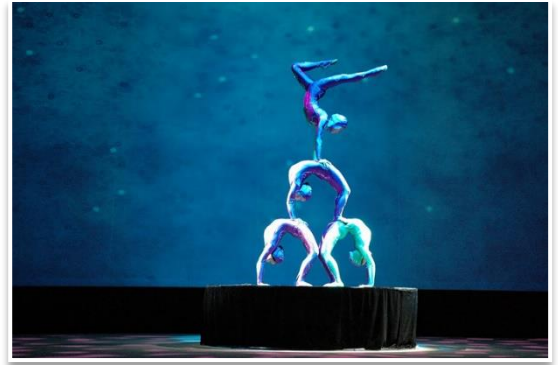
Szanghajscy akrobaci, Szanghaj