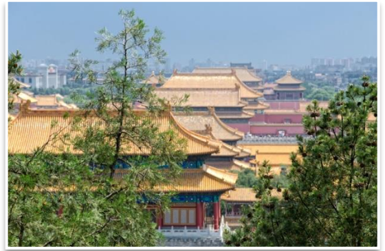
Zakazane Miasto widziane z Jingshan, Pekin