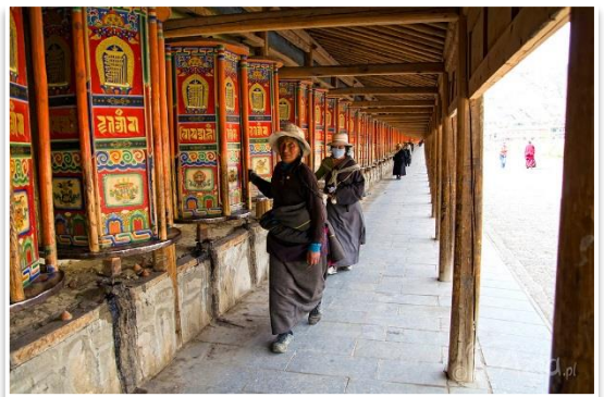
Młynki modlitwne w Klasztorze Labrang, Xiahe