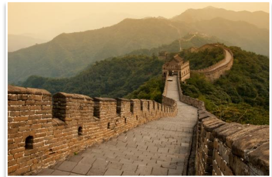
Wielki Chiński Mur

Rozpoczniemy dzień wyjazdem daleko poza Pekin, do oddalonego o 116km na północ Jinshanling . Tam wdrapiemy się na Wielki Chiński Mur . Naszym zdaniem, ten właśnie odcinek jest najpiękniejszy i jednocześnie, ze względu na swoje oddalenie od Pekinu, przyciąga najmniej turystów. Dlatego właśnie tam jedziemy! Po powrocie do Pekinu (z przerwą na krótki powrót do hotelu), dzień zakończymy nad Jezioro Hou Hai i jego barami z muzyką graną na żywo. Kolacja we własnym zakresie. Nocleg w Pekinie.