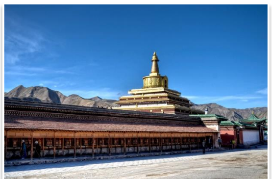
Złota Pagoda w Xiahe