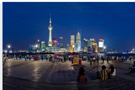
Dzielnica Pudong i Oriental Pearl Tower,