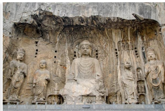
Grotty Smoczycy Wrót, Luoyang

Dzień zaczniemy od wizyty w taoistycznej świątyni Zhongyue . Następnie przejedziemy autobusem do Luoyang , aby podziwiać Grotty Smoczycy Wrót (Dziesięciu Tysięcy Buddów). Później udamy się na stację kolejową, skąd pociągiem wielkich prędkości pojedziemy do Xi'an (czyt. Si-an) – jednej z najważniejszych, dawnych stolic cesarstwa. Po kolacji udamy się jeszcze przed Pagodę Wielkiej Gęsi , gdzie zobaczymy między innymi pokaz tańczących fontann.