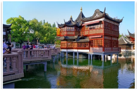
Herbaciarnia przy ogrodzie Ju, Szanghaj