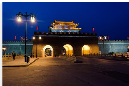
Brama miejska, Qufu