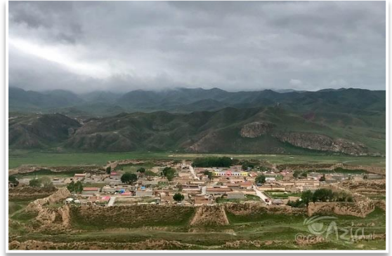
Bajiao – wioska-forteca z 2000 letnią historią