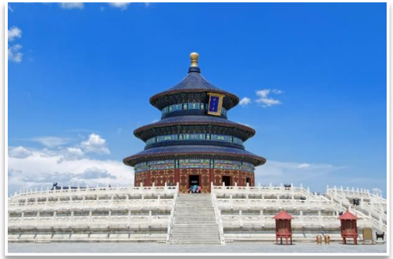
Świątynia Nieba, Pekin