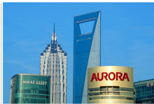
Dzielnica Pudong, Szanghaj

❖ Oriental Pearl Tower (Wieża Perłowa) – 468 metrowa wieża telewizyjna jest architektonicznym symbolem Szanghaju. To 5-ta