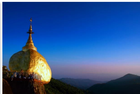
Złota Skała na Górze Kyaiктиyo