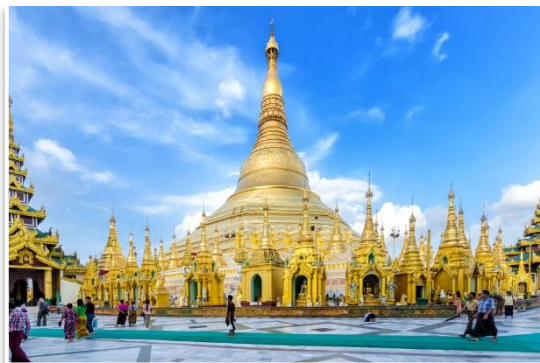
Pagoda Szwedagon, Rangun