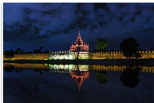
Mury pałacu królewskiego, Mandalaj