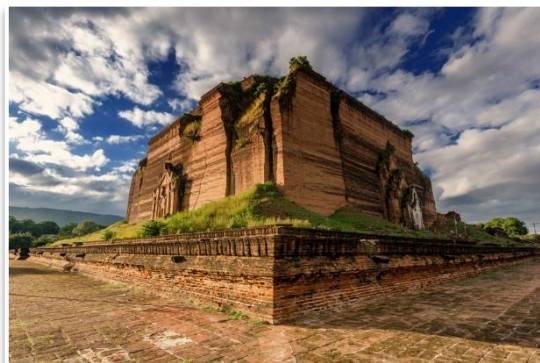
Pahtotawgyi Paya, Mingun

Po śniadaniu czeka nas relaksujący rejs statkiem po największej rzece Birmy – Irawadi . Po godzinie, dopłyniemy do Mingun – niewielkiej osady, słynącej z kilku, monumentalnych budowli. Zobaczymy tam m.in. Mingun Pahtotawgyi Paya – niedoszłą największą pagodę na świecie, Wielki Dzwon Mingun oraz Świątynię Hsinbyume . Do Mandalaj wrócimy ponownie rzeką. Dzień zakończymy klasycznym „widoczkiem” z Birmy – zachodem słońca na najdłuższym na świecie, tekowym moście w Amarapurze . Kolacja i nocleg w Mandalaj.