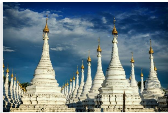
Pagoda Kuthodaw, Mandalaj