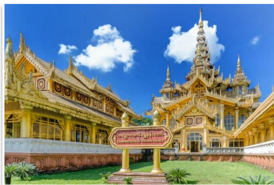
Pałac Kanbawzathadi, Bago

Po śniadaniu, wyjedziemy autobusem z Rangun do Bago (Pegu). Przejazd zajmie około 2 godzin. Po drodze zatrzymamy się jeszcze przed cmentarzem wojennym Taukkyan , upamiętniającym poległych żołnierzy Commonwealth z okresu II wojny światowej. Następnie, po przyjeździe do Bago odwiedzimy najbardziej okazałe zabytki dawnej stolicy królestwa Hanthawaddy. W czasie swojej świetności zbudowano tam wiele pięknych świątyń oraz pałaców. Szereg z nich nadal zachwyca wdziękiem oraz rozmachem budowy. Zobaczymy m.in.: drugi największy na świecie posąg leżącego Buddy , zrekonstruowany pałac królewski i kilka innych miejsc związanych z buddyzmem. Następnie, po obiedzie, opuścimy autobusem Bago i udamy się do miasteczka Kinpun – bazy wypadowej dla Złotej Skąły. Przejazd zajmie około 3 godzin. Kolacja i nocleg w Kinpun.