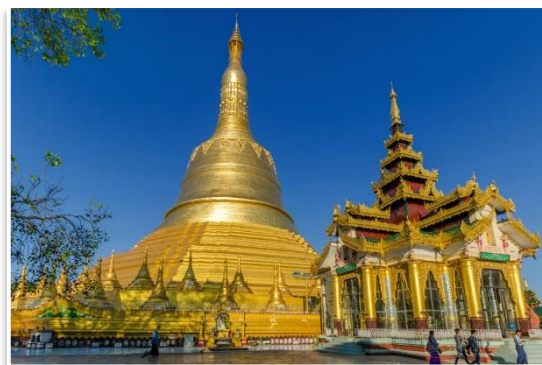
Pagoda Shwemawdaw, Bago