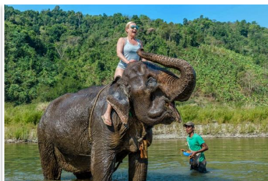
Rezerwat słoni nieopodal Thandwe

❖ Rezerwat słoni nieopodal Thandwe (impresja fakultatywna) - w ramach pobytu na plaży Ngapali będzie można odbyć wycieczkę do rezerwatu słoni nieopodal Thandwe. To rządowy ośrodek, w którym