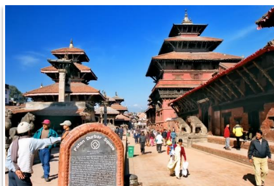
Plac Durbar, Patan