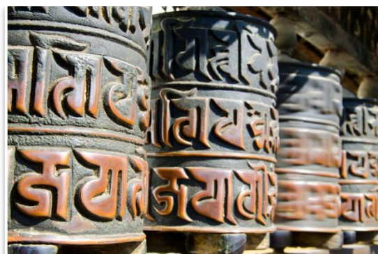
Młynki modlitewne, Katmandu