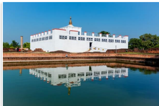
Świątynia Maya Devi, Lumbini

Po śniadaniu zwiedzimy Świątynię Maya Devi - jedno z czterech świętych miejsc buddyzmu. Według tradycji urodził się tu książę Siddhartha Gautama, który stał się potem Buddą Śakjamunim. Odwiedzimy też kilka znajdujących się na terenie kompleksu buddyjskich klasztorów , należących do wspólnot buddyjskich z różnych krajów Azji. Następnie, po obiedzie, pojedziemy prywatnym pojazdem w stronę nepalskiego odpowiednika Zakopanego – miasta Pokhara . Przejazd zajmie on nam około 5 godzin i będzie wiódł bardzo malowniczą drogą przecinającą kolejne pasma niższych Himalajów. Zakwaterowanie w hotelu, czas wolny. Nocleg w Pokharze, kolacja we własnym zakresie.