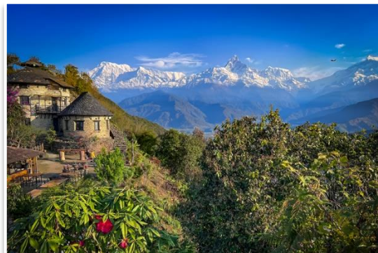
Pasma Annapurny oglądane z Pokhary

Dodatkowa atrakcja Wizyta przy Stupie Światowego Pokoju – to współczesna, buddyjska budowla, umiejscowiona na szczycie wzgórza, bezpośrednio powyżej Jeziora Phewa. Rozpościera się z niej piękny widok na Masyw Annapurny i szczyt Machupachare. Dostać się tam można łodzią przez jezioro, a następnie pieszo, na szczyt wzgórza. Wejście zajmuje około 1 godzinę, zejście (tą samą drogą) około 40 minut. Istnieje też możliwość wjechania na szczyt taksówką. Cena to około 5-6 USD/os. na pokrycie kosztów transportu.