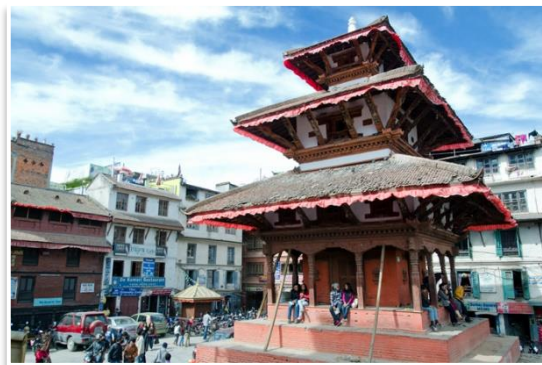
Plac Durbar, Katmandu

Ostatnim akcentem wyjazdu będzie kilkugodzinny spacer po gwarych i malowniczych zaułkach starego Katmandu, którego kulminacją będzie wizyta na stołecznym placu koronacyjnym oraz w starym Pałacu Królewskim - Hanuman Dokha. Drugą część dnia pozostawimy uczestnikom do własnej dyspozycji. Będzie można ten czas przeznaczyć na ostatnie zakupy lub ostatnie spacerunki po mieście. Obiad i kolacja we własnym zakresie, nocleg w Katmandu.