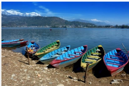
Jeziro Phewa, Pokhara

Dodatkowa atrakcja Wzgórze Sarangkot – ze szczytu rozpościera się najbardziej pełna panorama Himalajów, pasma Annapurny i szczytu Machupachare. Wjazd na wzgórze odbywa się w całości taksówkami. Na sam nam szczyt prowadzi niedługa, pieszka ścieżka. Cena to około 5-6 USD/os. na pokrycie kosztów transportu.