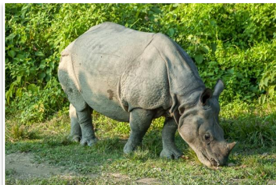
Nosorożec w Parku Narodowym Chitwan

Po śniadaniu opuścimy Dolinę Katmandu i prywatnym pojazdem pojedziemy w kierunku Parku Narodowego Chitwan . Przejazd zajmie nam około 5 godzin. Po dotarciu do miasteczka Sauraha, zakwaterowanie w hotelu-ogrodzie, późny obiad i spacer po miasteczku, nad brzeg Rzeki Rapti, by podziwiać malowniczy zachód słońca na skraju dżungli. Po kolacji obejrzymy pokaz „tańca z kijami” miejscowego ludu Tharu. Nocleg w Sauraha.