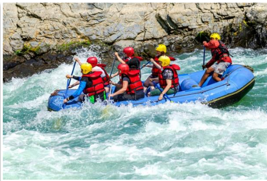
Rafting na Rzece Trisuli

* Spływ pontonem po rzece nie jest obowiązkowy i będzie można z niego zrezygnować. W takiej sytuacji uczestnik zostanie od razu przetransportowany do obozu nad rzeką, gdzie poczeka na resztę grupy.