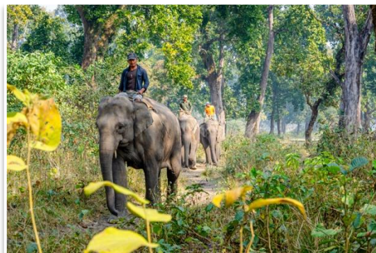
Słonie w Parku Narodowym Chitwan