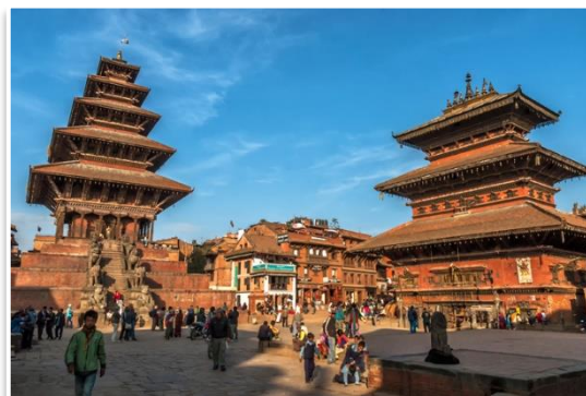
Świątynia Nyatapola, Bhaktapur