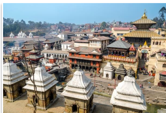
Świątynia Pashupatinath, Katmandu