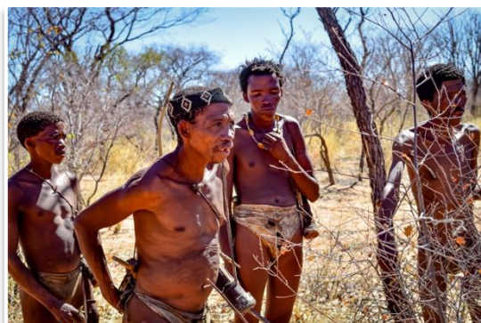
San / Buszmeni

Wczesny poranek poświęcimy na objazd wodopojów w bezpośredniej bliskości obozu Namutoni. Następnie opuścimy Etoszę i skierujemy się do Grootfontein celem uzupełnienia zapasów i paliwa. Dalej droga doprowadzi nas w busz, do terenów zamieszkałych przez lud San (Buszmenów) . Zamierzamy spędzić z nimi całe popołudnie oraz zanoć przy ich wiosce . Celem będzie poznanie Buszmenów i próba zrozumienia jak jeszcze niedawno wyglądało ich życie. Z jakimi ograniczeniami muszą się dzisiaj mierzyć. Wyjdziemy z nimi w busz, aby dowiedzieć się z jakich roślin korzystają. Dowiemy się w jaki sposób tropią zwierzynę i jak niegdyś polowali. Będziemy mogli samodzielnie zrobić sobie łuk i spróbować swoich sił w strzelaniu z niego do celu. W naszej ocenie, to bardzo emocjonalne i ważne spotkanie z ludźmi, których kultura na naszych oczach zaciera się we współczesności. Nocleg w obozie przy wiosce Buszmenów.