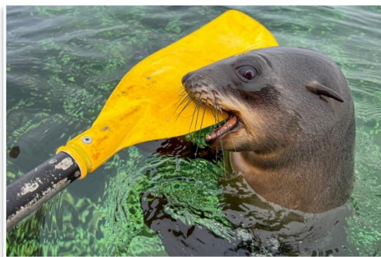
Kajakiem pośród stada uchatk