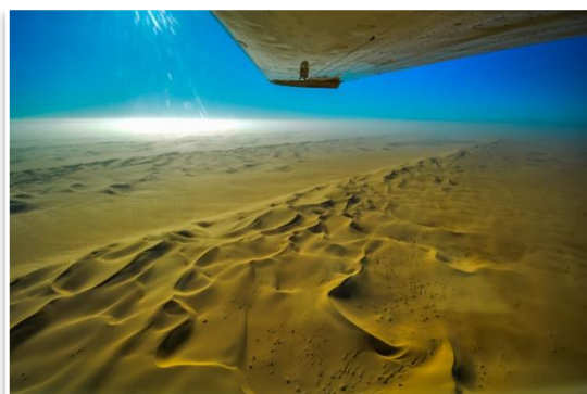
Loty widokowe nad Pustynią Namib

Wczesnym rankiem sugerujemy wyjechać do Walvis Bay , aby wziąć udział w wyprawie samochodowej do Sandwich Harbour . Popołudnie zaś można poświęcić na zapadający w pamięć lot widokowy nad Wybrzeżem Szkieletów , jazdę na kładach po pustyni lub spacer po Swakopmund . Kolację możemy również zjeść wspólnie, w jednej z doskonałych restauracji miasta.