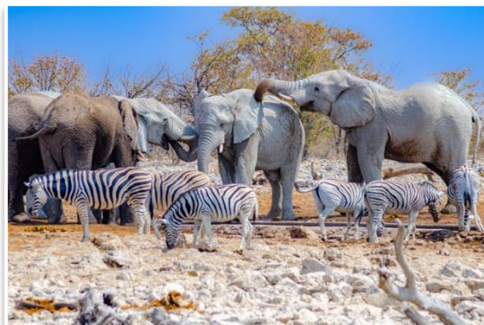
Park Narodowy Etosza

Dzień rozpoczniemy wcześnie, bo jak najszybciej chcemy przekroczyć Bramę Andersona , prowadzącą do Parku Narodowego Etosza . Podróżować będziemy samodzielnie , własnymi samochodami, przemieszczając się pomiędzy kolejnymi wodopojami, przy których powinny gromadzić się zwierzęta. To od naszej cierpliwości oraz szczęścia będzie zależeć co uda się nam zobaczyć. Noc spędzimy w pustynnym obozie położonym na terenie parku. Po zmroku, będzie możliwość bezpiecznej obserwacji zwierząt przy obozowym wodopoju. To spektakl na przynajmniej kilka godzin.