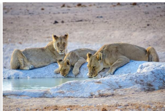
Park Narodowy Etosza

Kolejny pełny dzień w Parku Narodowym Etosza poświęcimy na podglądanie dzikich zwierząt . Tak jak dzień wcześniej, będziemy przemieszczać się własnymi samochodami, od wodopoju do wodopoju. Na koniec dnia dotrzemy do obozu Namutoni (na terenie parku), który również umożliwia nocną, dyskretną obserwację zwierząt gromadzących się przy wodopoju.