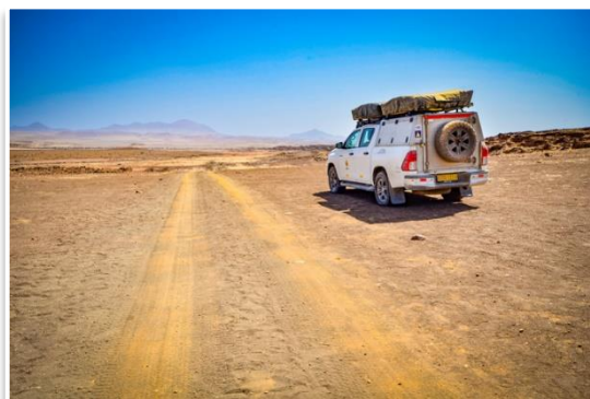
Odludne i surowe obszary okolic Krateru Messum

Wczesnym rankiem opuścimy Swakopmund i pojedziemy niesławnym Wybrzeżem Szkieletów do Cape Cross . Tam odwiedzimy jedną z najliczniejszych kolonii uchatk południowoafrykańskich . Następnie zjedziemy z asfaltu i drogami szutrowymi będziemy poruszali się przez odludne i surowe obszary okolic Krateru Messum . Naszym celem będzie odnalezienie „świętego graala” botaników, Welwiczii Przedziwnej . Po drodze zobaczymy Masyw Brandberg , z najwyższym szczytem Namibii. Ostatnie 10 km drogi do obozu będzie wiodło przed wymagającą dla kierowców dolinę Rzeki Ugab. Tam spędzimy nadchodzącą noc. Jeśli szczęście dopisze, gośćmi w obozie mogą być pustynne słonie , które przystosowały się do życia w tym surowym terenie.