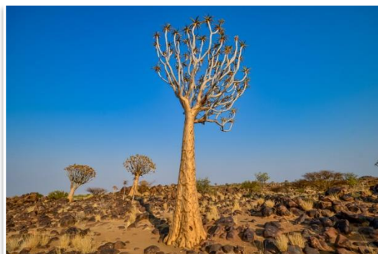
kokerboom – drzewo kołczanowe

Windhoek opuścimy wcześniej rano odwiedzając Akr Bohaterów – miejsce poświęcone pamięci osób, które przyczyniły się do uzyskania przez Namibię niepodległości w 1990 roku. To doskonałe miejsce aby poznać zarys niedługiej historii kraju. Następnie udamy się do obozu nieopodal farmy Bülls Port . Przejazd tam zajmie około 3 godzin. Na miejscu zostawimy na parę godzin samochody i udamy się na pieszą przechadzkę oznakowanym pieszym szlakiem. Po drodze będzie można podziwiać unikalne kokerboom – drzewa kołczanowe . Nocleg w obozie.