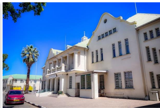
Dworzec kolejowy w Windhoek