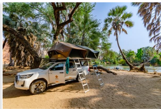
Obóz nad Rzeką Kunene

Każdy potrzebuje trochę wytchnienia i dlatego proponujemy dzień całkowicie wolny od jazdy i pakowania obozu . Czas będzie można poświęcić na spacer nad rzeką, relaks w obozie, sprawy porządkowe, czy wizytę w lokalnym... disco barze.