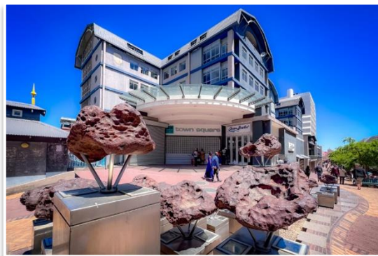
meteoryty Gibeone w Windhoek

Tego dnia musimy oddać samochody i opuścić gościnną Namibię. Zanim to jednak nastąpi, przed południem, będziemy chcieli zobaczyć najciekawsze zabytki stolicy . Zobaczymy architektoniczną wizytówkę miasta, kamienny kościół – Christuskirche , wstąpimy do Muzeum Pamięci i Narodowej Galerii Sztuki , zajrzemy do zabytkowego dworca kolejowego i pobliskiego muzeum kolei trans-namib . Przejdziemy też przez centrum handlowe z wystawionymi meteorytami Gibeon . Zajrzemy do Buszmen Art Gallery oraz do Starego Browaru . W drugiej części dnia oddamy samochody i zostaniemy przewiezieni na lotnisko, skąd odlecimy (z przesiadką) do Warszawy .