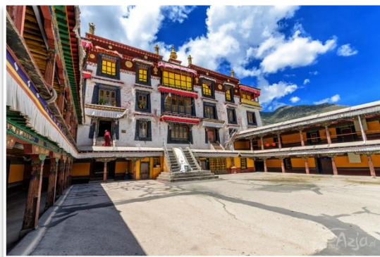
Klasztor Drepung, Lhasa