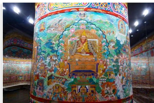
Największa na świecie thanka, Xining