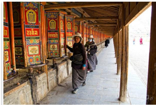
Młynki modlitewne w Klasztorze Labrang, Xiahe

Po lądowaniu w Lanzhou (stolicy chińskiej prowincji Gansu) obiad*, a następnie transfer prywatnym autobusem do Labrang / Xiahe ( wym. Siahe ) – pierwszej enklawy tybetańskiej w regionie Amdo. Po przyjeździe na miejsce kolacja i nocleg w hotelu.