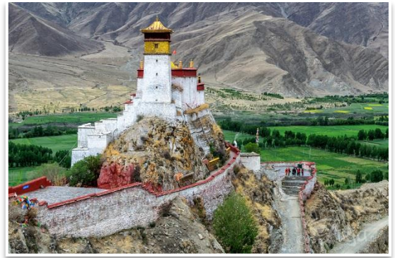
Zamek Jumbu Lhakang

Na dworzec kolejowy w Lhasie dotrzemy przed południem. Tego dnia naszym celem nie będzie sama Lhasa, lecz Samye . Po wyjeździe z Lhasy udamy się najpierw do Tsetang – czwartego największego miasta Tybetu, celem zameldowania się w lokalnym biurze bezpieczeństwa. Jeśli czas pozwoli udamy się jeszcze na moment do zamku Jumbu Lhakang w Dolinie Jarlung, uważanego za kolebkę państwowości tybetańskiej. Kolacja i nocleg w hotelu w Samye.