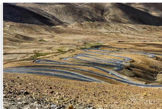
Droga do Mt. Everest