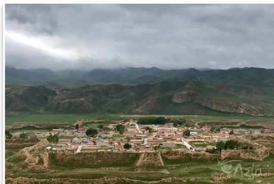
Bajiao – wioska-forteca z 2000 letnią historią