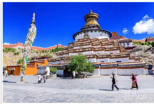
Klasztor Pelkhor Choede

Dzień rozpoczniemy zwiedzaniem Klasztoru Pelkhor Choede oraz niezwyklej stupy Gyantse Kumbum . Następnie wejdziemy jeszcze na szczyt Fortecy Gyantse , z której to rozpościera się fantastyczny widok na okolicę. Następnie ruszymy do Sakya – prawdopodobnie najpiękniejszego i najbardziej tybetańskiego miasteczka w Tybetańskim Regionie Autonomicznym. Na miejscu zwiedzimy Klasztor Sakya – historyczną siedzibę tradycji buddyjskiej o tej samej nazwie. Obiad i kolacja w lokalnych restauracjach we własnym zakresie. Nocleg w hotelu w Sakya.