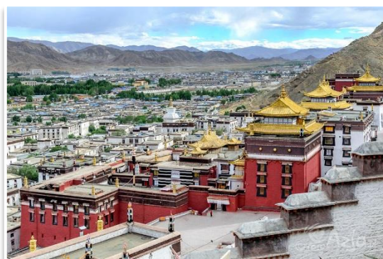
Klasztor Tashilhunpo w Shigatse

Dzień rozpoczniemy od wizyty w Klasztorze Tashilhunpo w Shigatse. Następnie autobusem pojedziemy w kierunku Lhasy. Po drodze zatrzymamy się jeszcze w Klasztorze Yungdrungling – unikalnym, bo należącym do tradycji Bön. Późnym popołudniem dotrzemy do dawnej stolicy Tybetu i zarazem najważniejszego miasta regionu – Lhasy . Tego dnia odwiedzimy jeszcze po raz pierwszy tętniący życiem, handlem i pielgrzymami Plac Barkhor i dzielnice tybetańską . Obiad i kolacja w lokalnych restauracjach we własnym zakresie. Nocleg w hotelu w Lhasie.