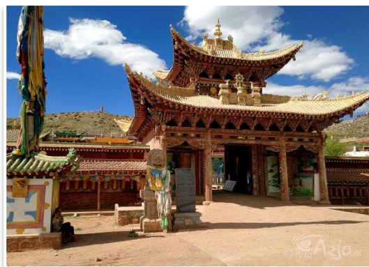
Klasztor Tseway należący do tradycji Bön

Dzień zaczniemy od zwiedzania Miasta Klasztorowego Labrang . Później odwiedzimy efektowną Pagodę Gongtang (Złotą Pagodę). Następnie zjemy obiad, po którym opuścimy Xiahe i udamy się prywatnym autobusem do Repkong / Tongren. Trasa będzie prowadzić przez bardzo malownicze tereny pastwisk Ganja . Po drodze odwiedzimy unikalny Klasztor Tseway oraz otoczoną murem wioskę-fortecę Bajiao z 2000 letnią historią. Kolacja i nocleg w Repkong / Tongren.